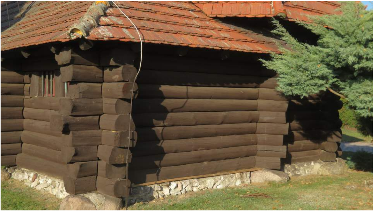
81. Pawełki – kościół, d. kaplica myśliwska, detal