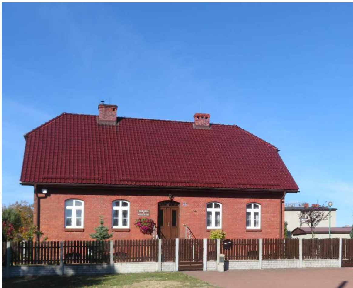
75. Olszyna – komora celna, ob. plebania 76. Olszyna – szkoła, ob. budynek mieszkalny