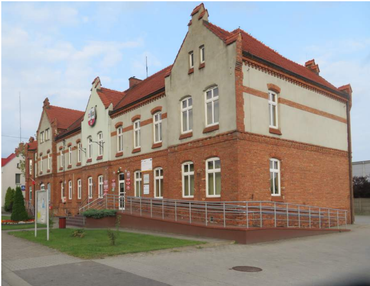
45. Herby – budynek dyrekcji kolei wschodniopruskiej, ob. Urząd Gminy 46. Herby – budynek rosyjskiej komory celnej, ob. mieszkalny