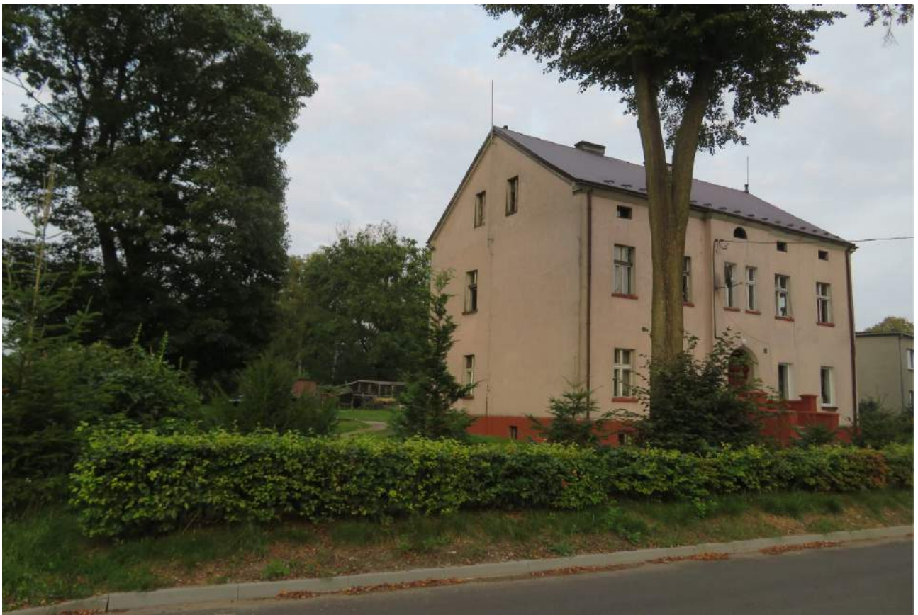
73. Mochala – budynek przyfabryczny, w głębi pozostałości parku. 74. Olszyna – kościół