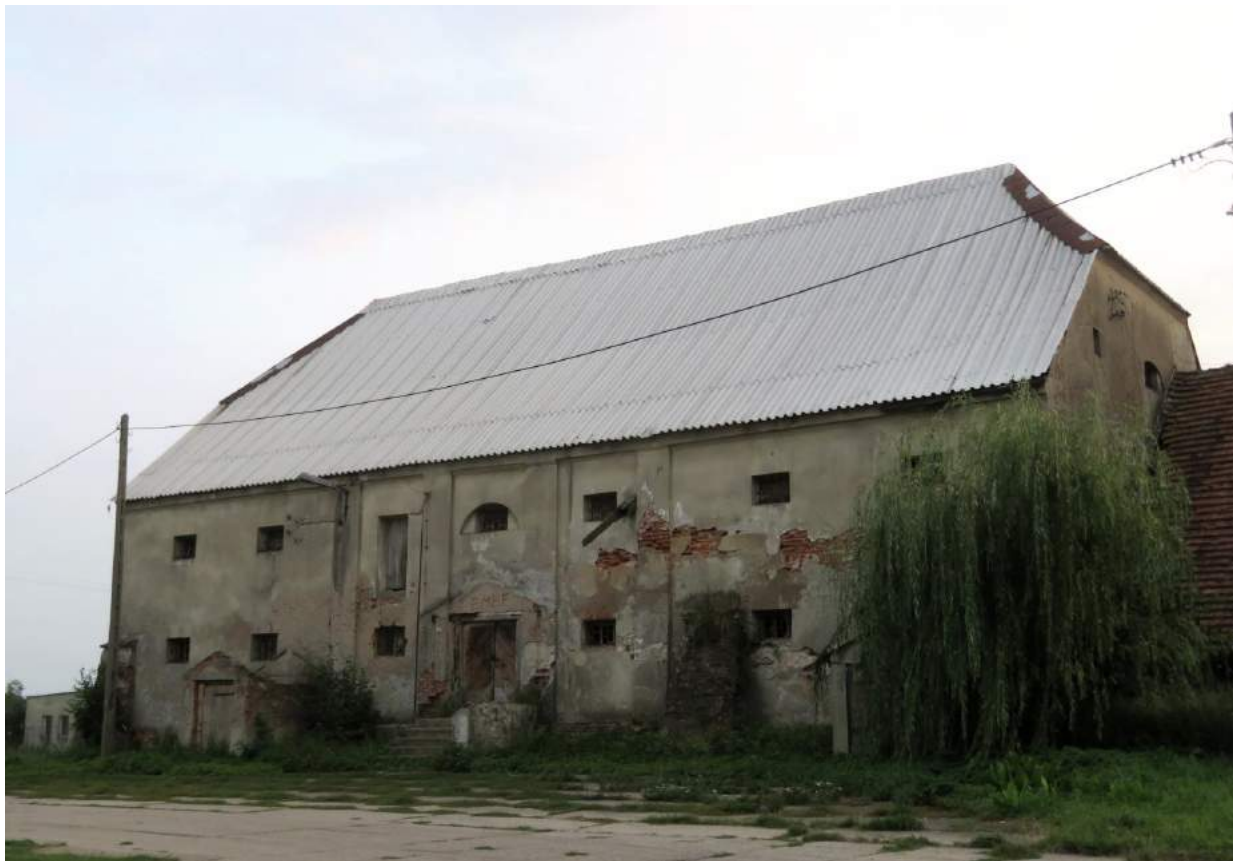
35. Hadra – spichlerz w zespole pofolwarczym 36. Harbułtowice – budynek pofolwarczy