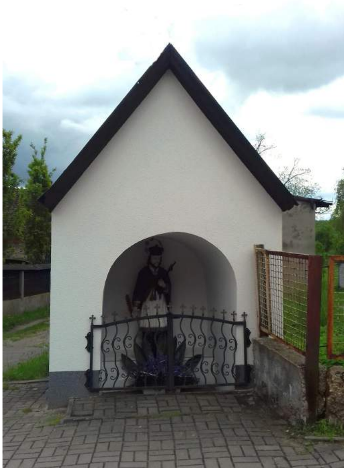
21. Cieszowa – kaplica św. Jana Nepomucena.