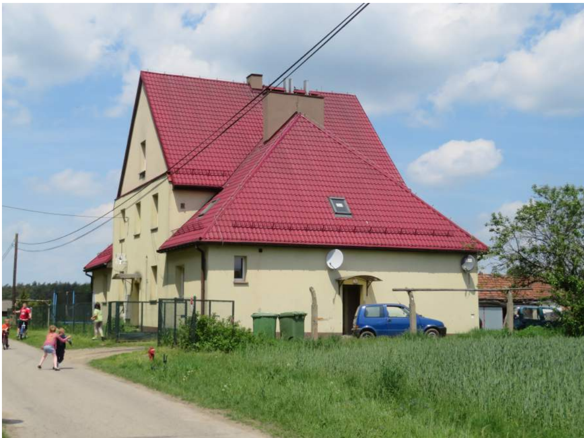
16. Braszczok – Międzywojenny posterunek straży granicznej