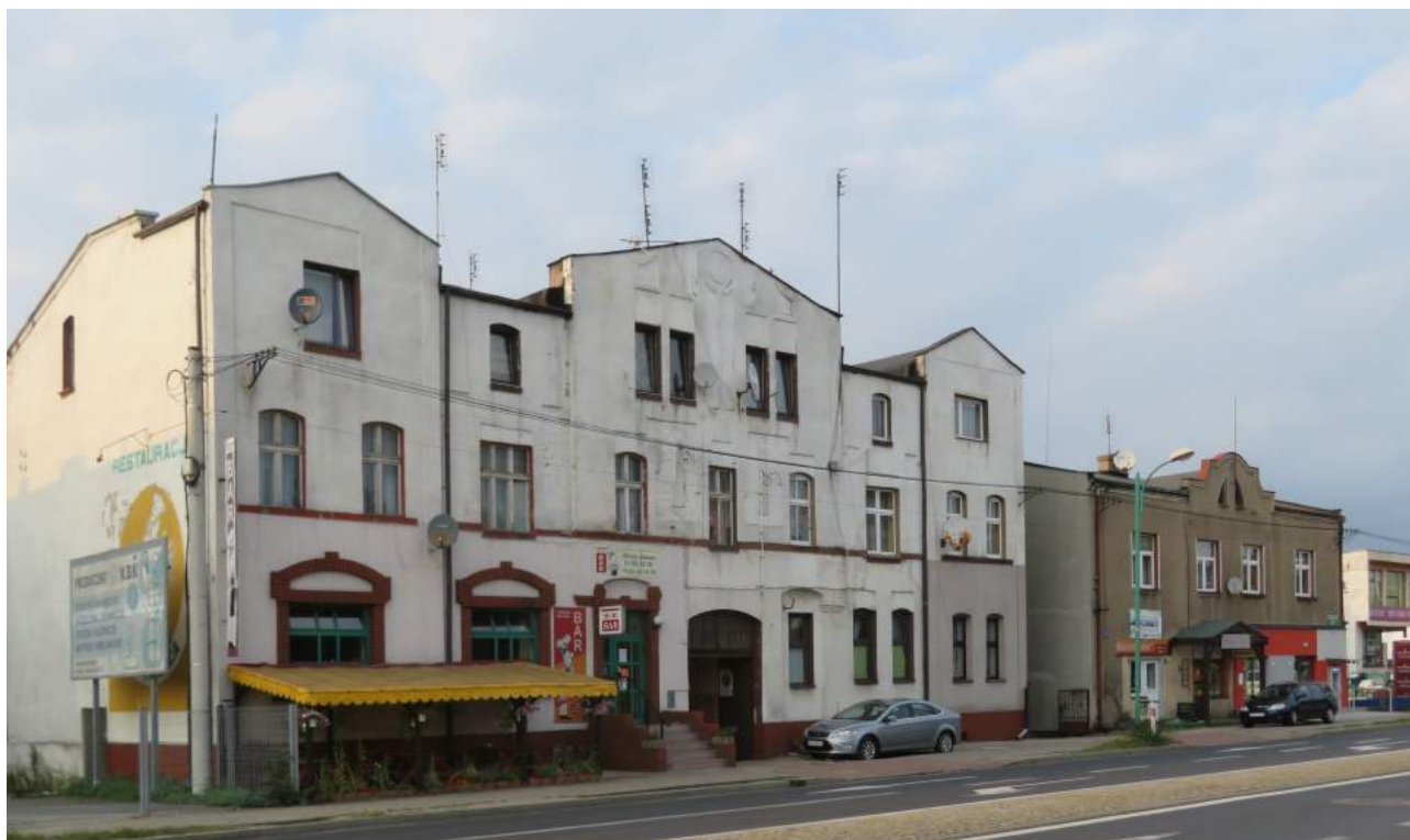
39. Herby – budynki ul. Lubliniecka 72-74 40. Herby – domy ul. Leśna 2-8, w głębi kościół