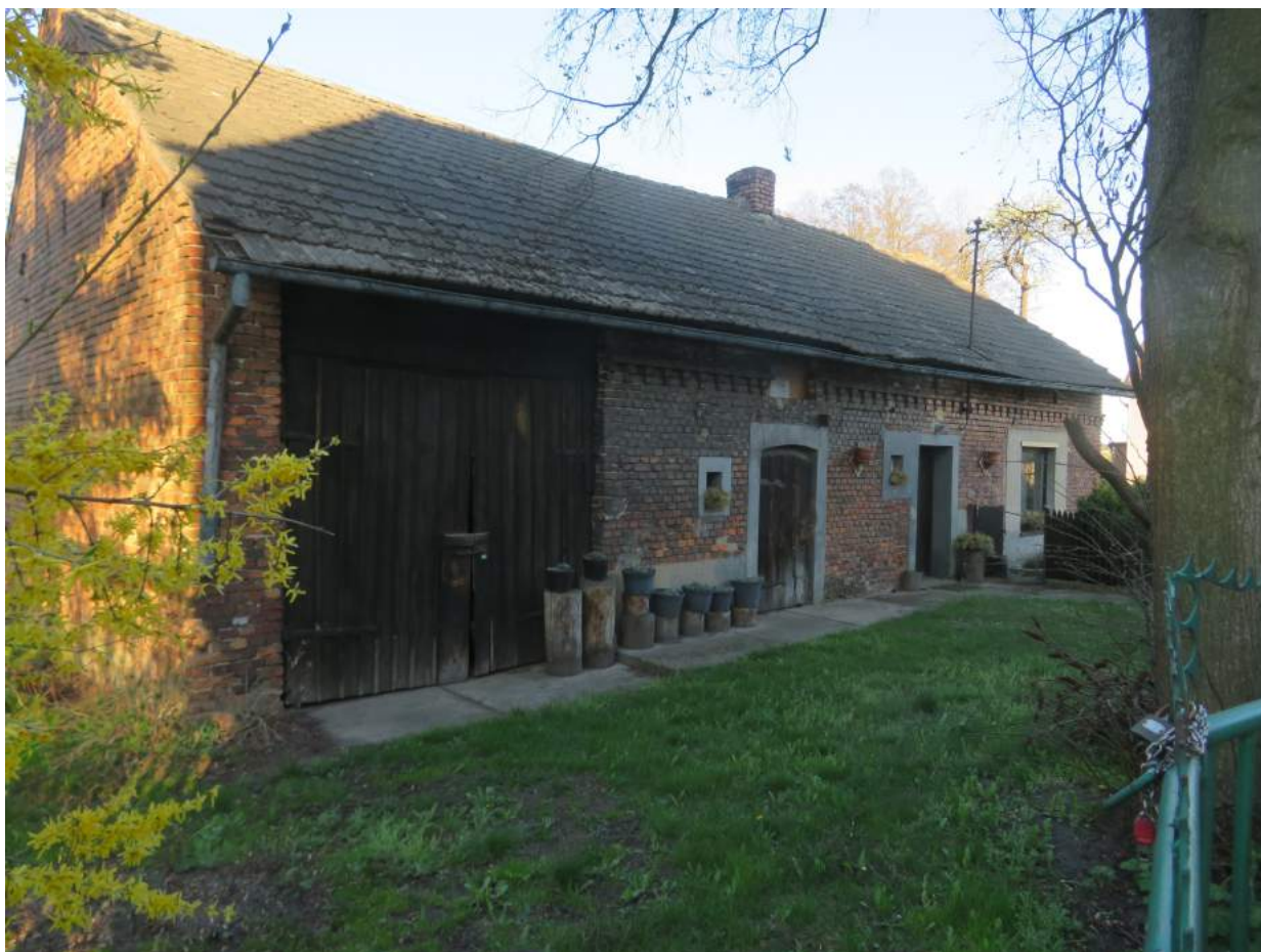
69. Lisów – budynek mieszkalny ul. Krótka 1, d. zagroda jednobudynkowa 70. Lisów – miejsce po cmentarzu