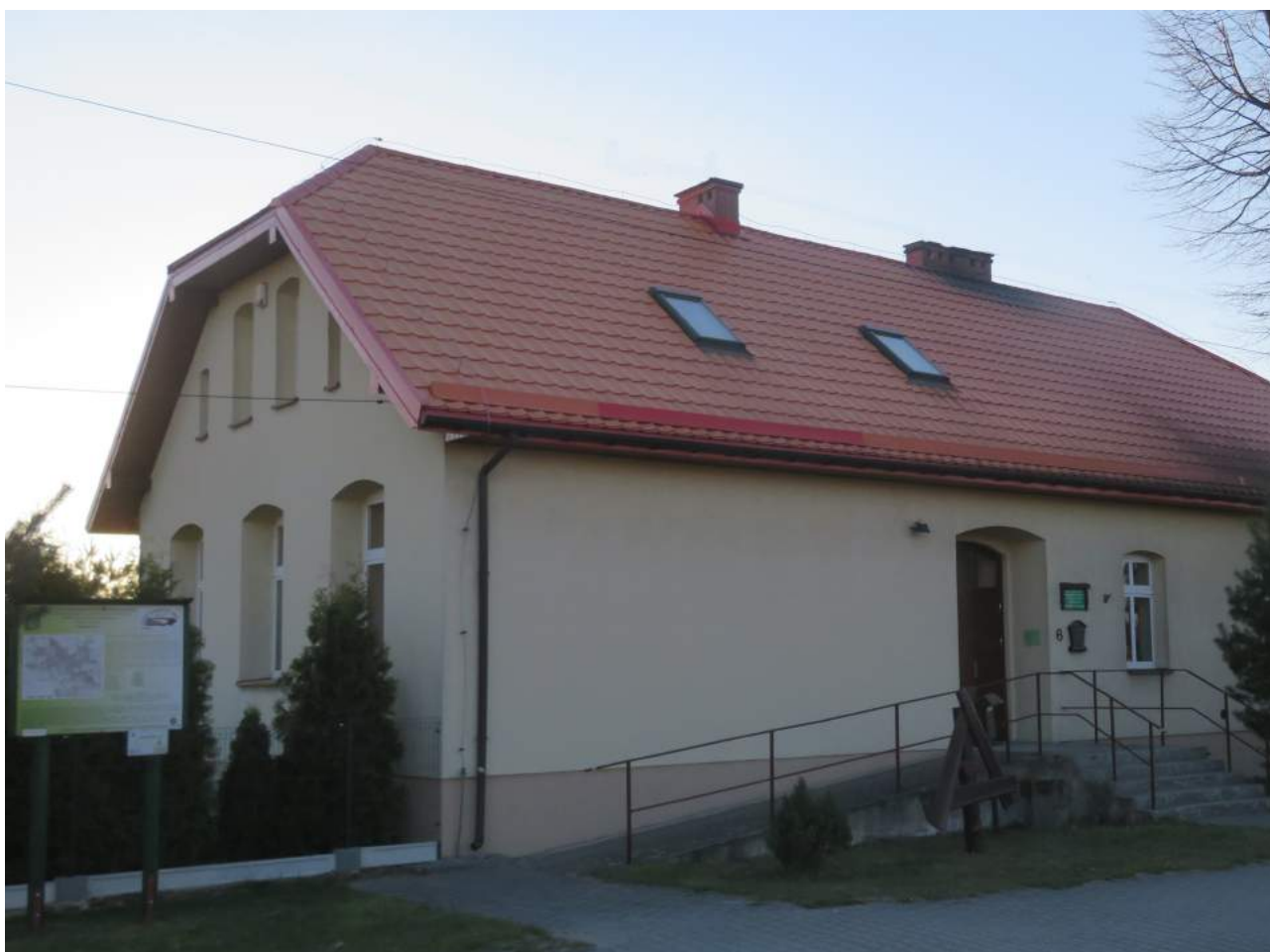
51. Kalina – szkoła, ob. budynek administracji PKLnGL 52. Kalina – budynek ul. Lompy 19