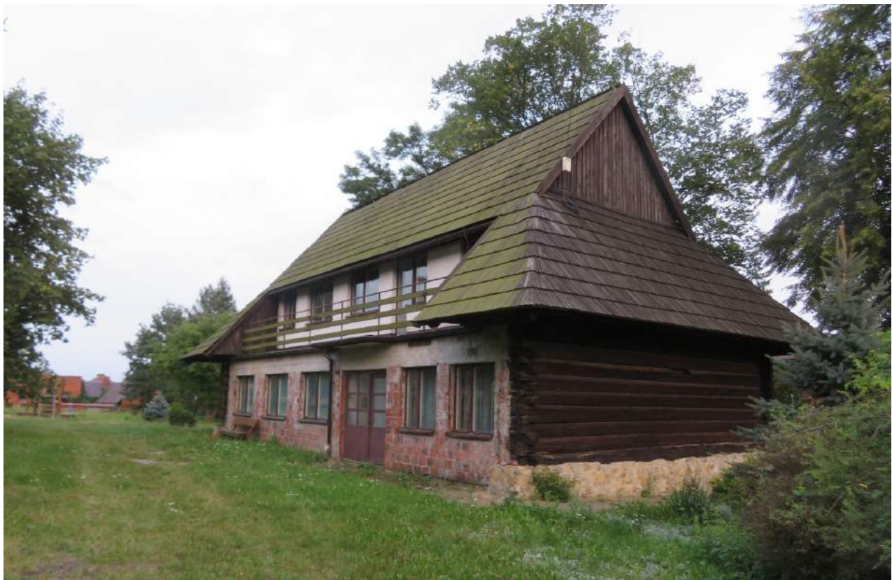
22. Cieszowa – spichlerz, ob. dom mieszkalny