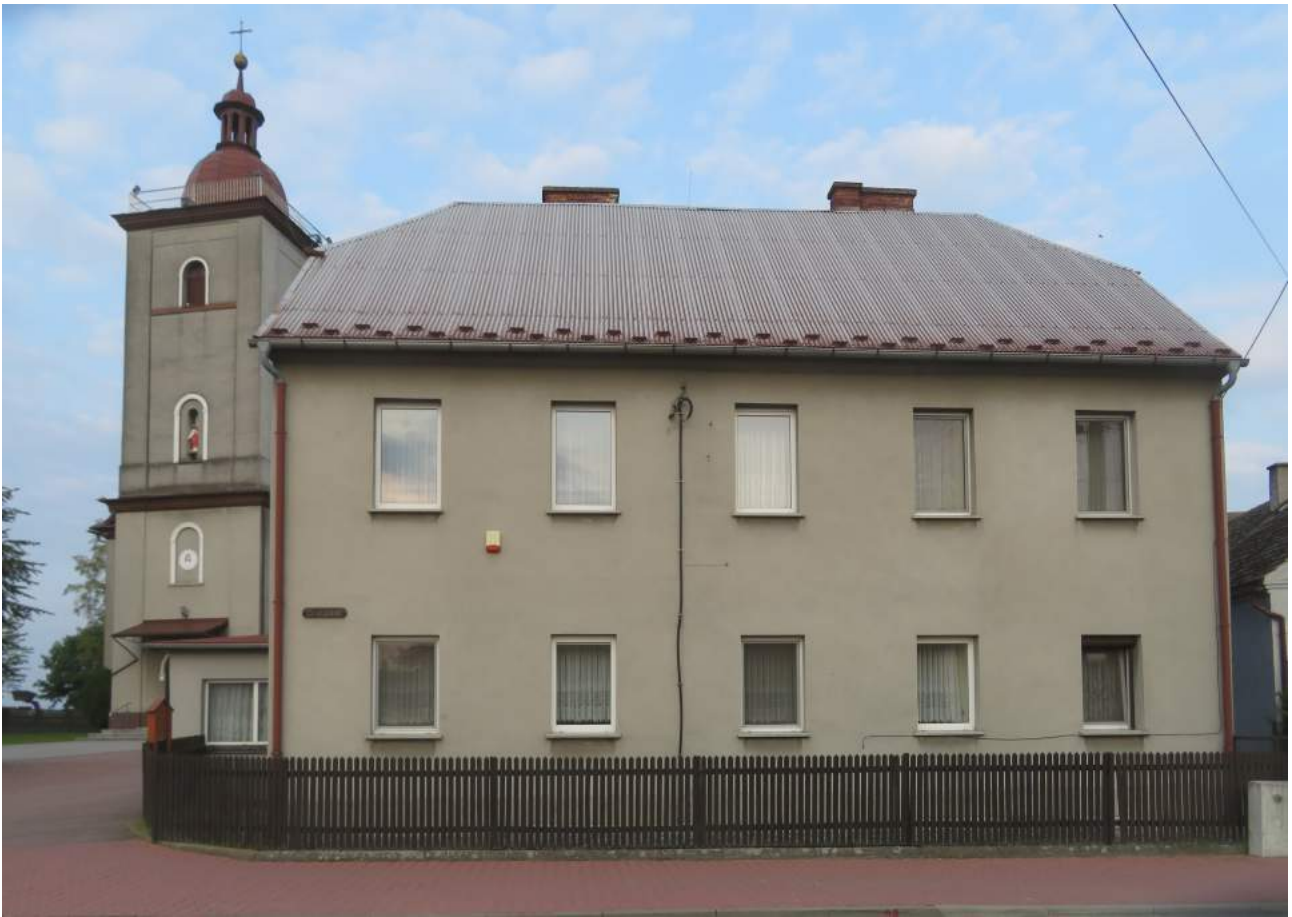
57. Kochanowice – Plebania – w głębi kościół