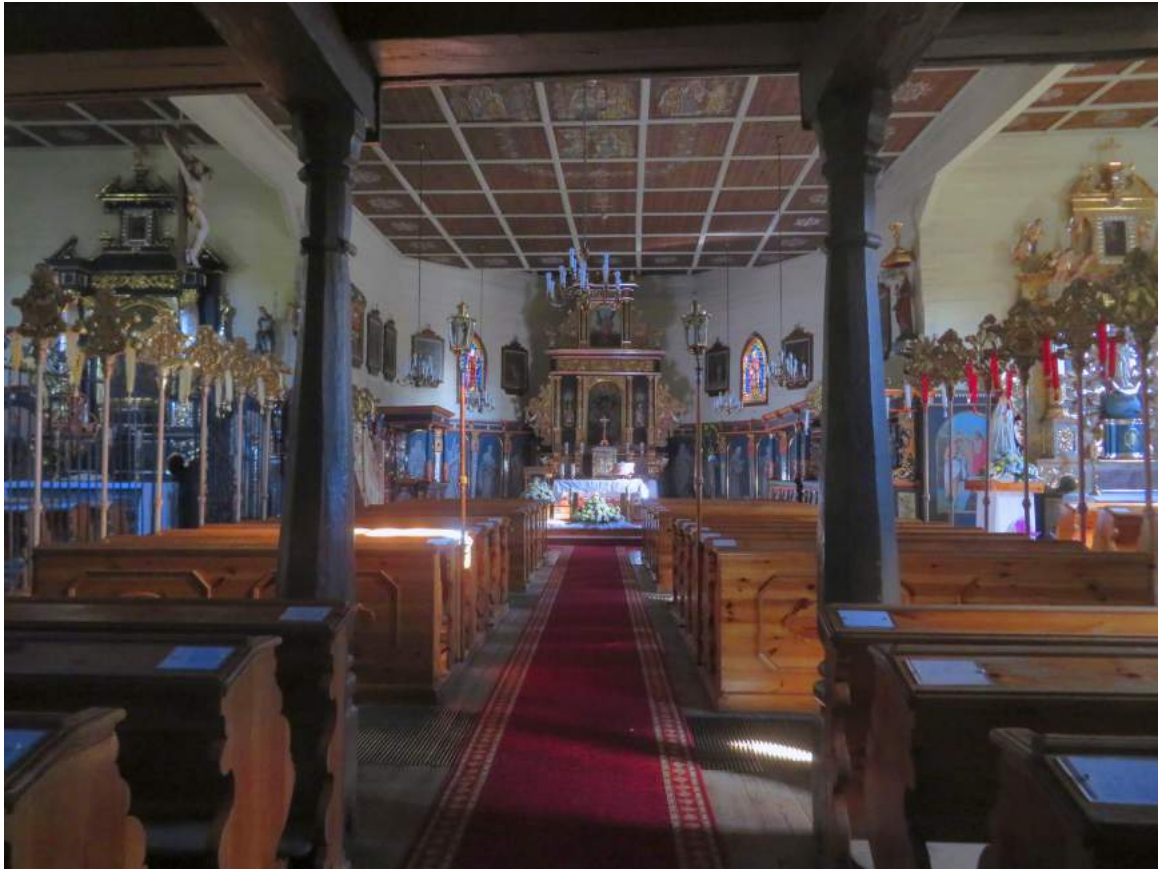
3. Boronów – kościół, wnętrze