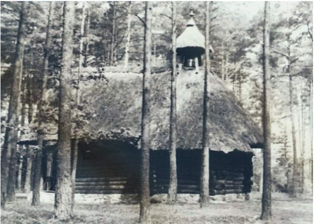
82. Zdjęcie przedwojenne kaplicy w pierwotnej lokalizacji - w Brzozie