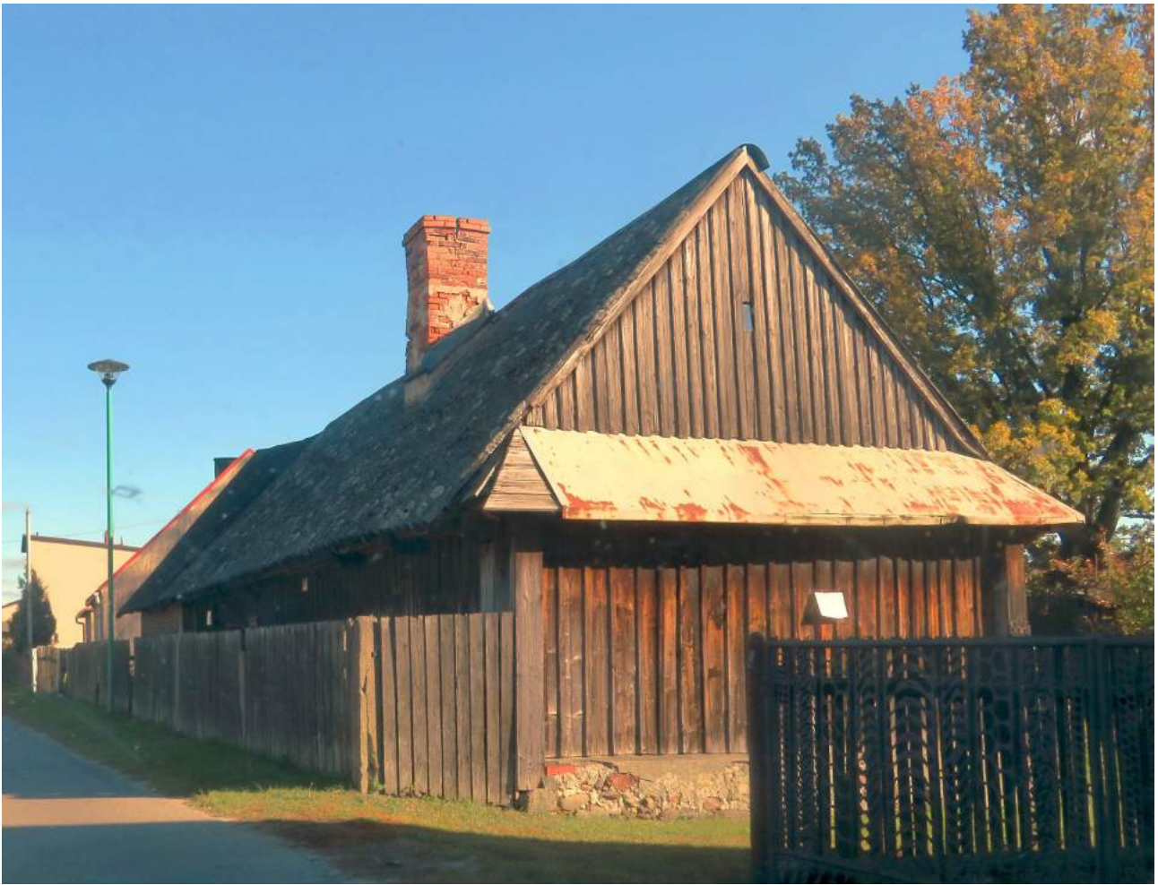
77. Olszyna – budynek ul. Jałowcowa 17