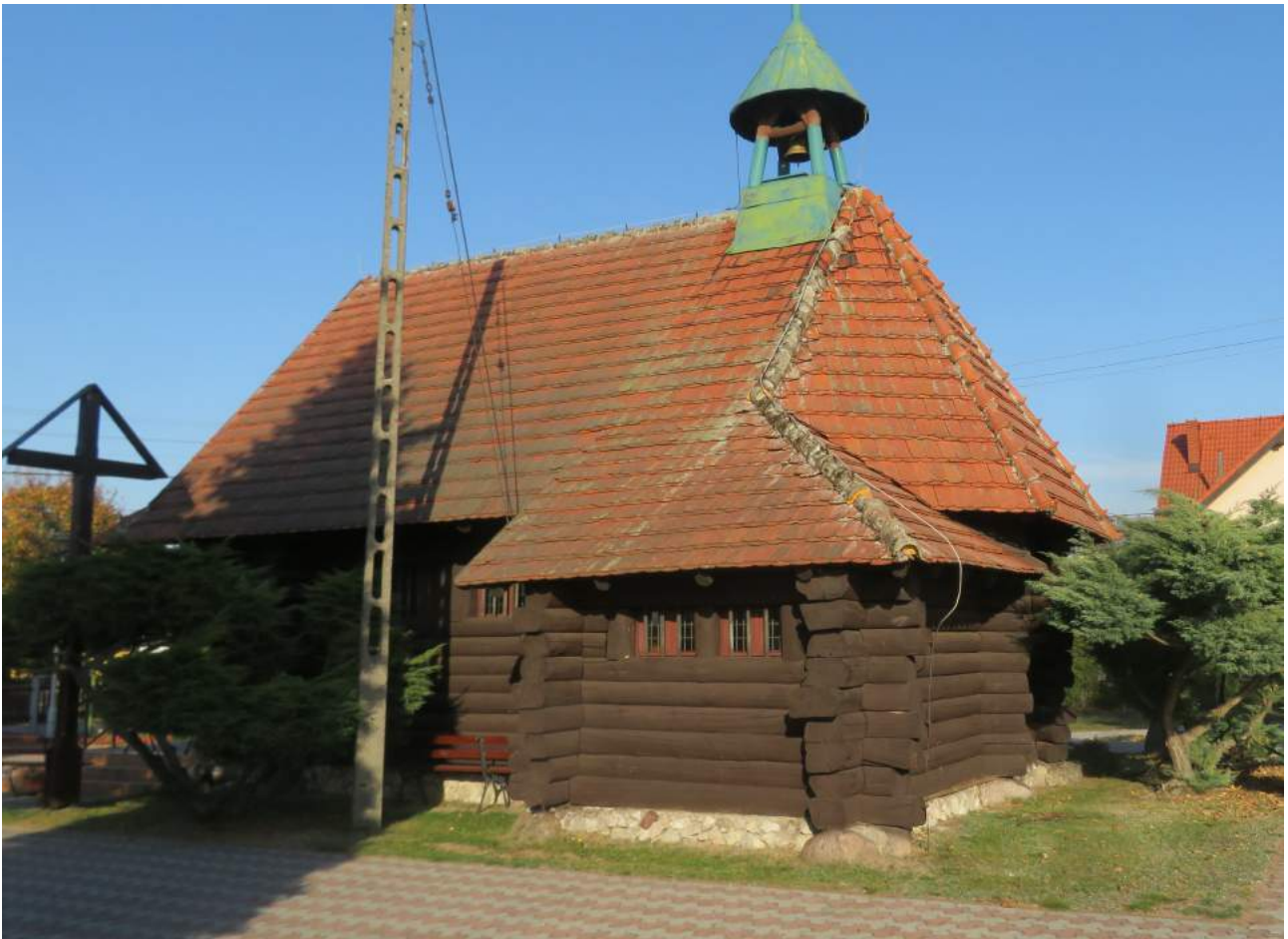
79, 80. Pawełki – kościół, d. kaplica myśliwska, przeniesiona z Brzozy