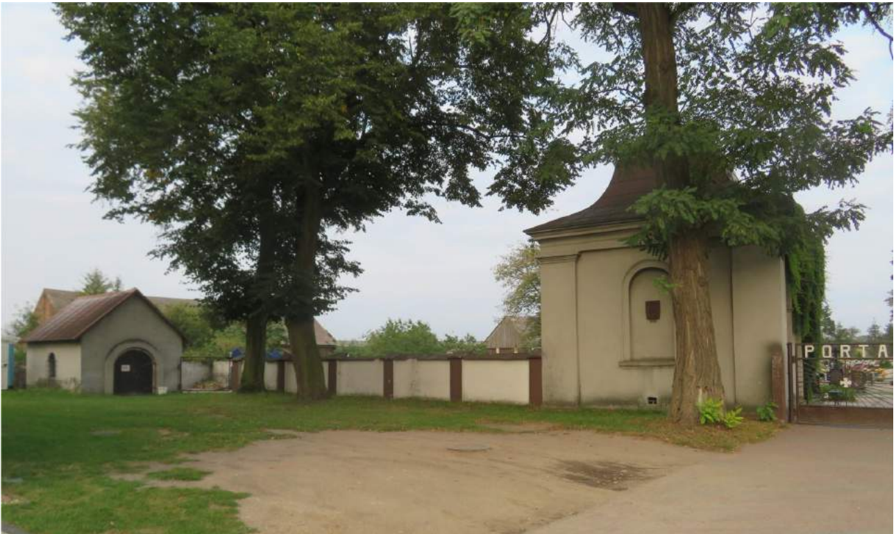
59. Kochanowice – kostnica i kaplica grobowa Aulocków, obecnie przedpogrzebowa 60. Kochanowice - kaplica grobowa Aulocków, obecnie przedpogrzebowa