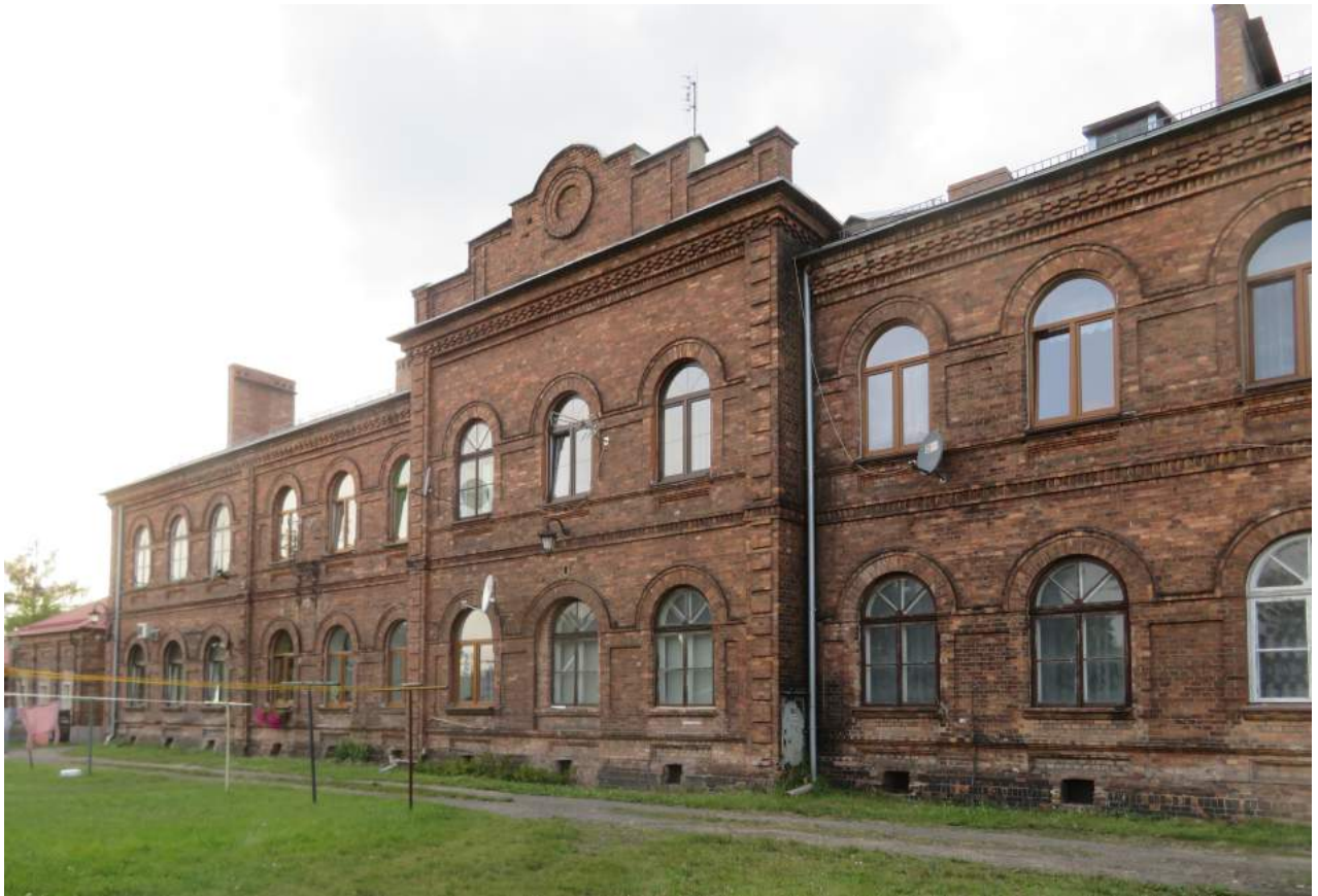
43. Herby – elewacja południowa dworca kolei herbskiej 44. Herby – budynki dworca kolei wschodniopruskiej