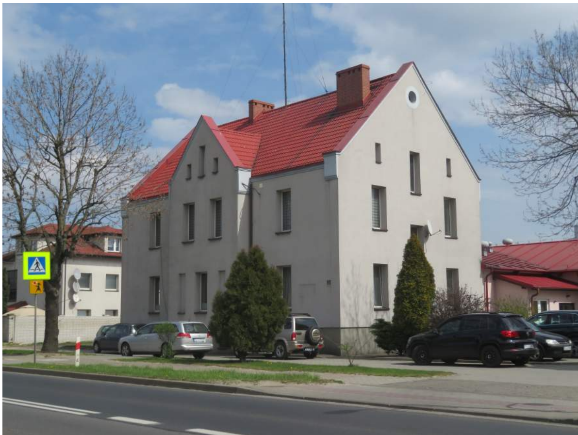
47. Herby – budynek pruskiej komory celnej, ob. urząd