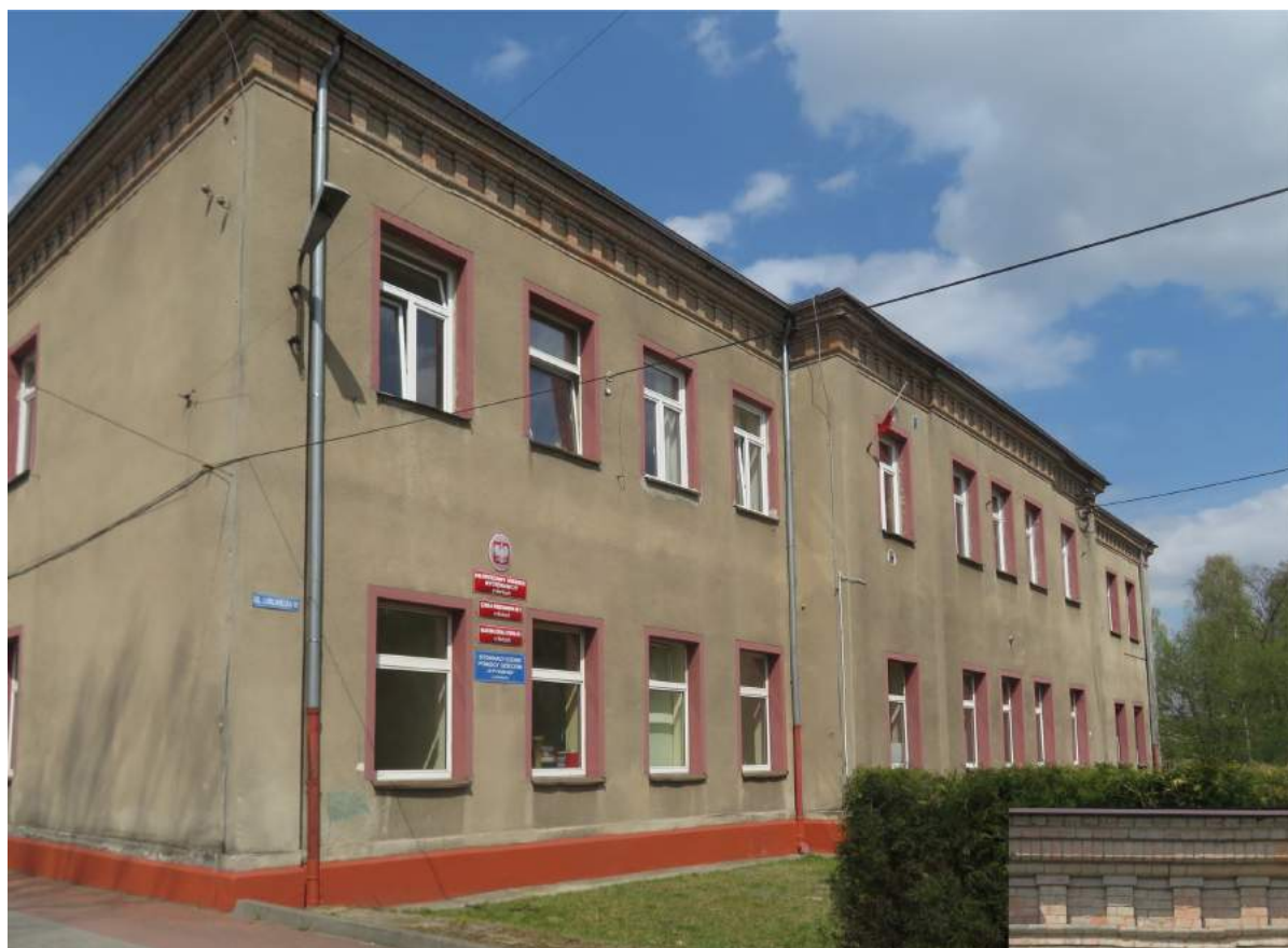
48. Herby – zakład wychowawczy, w prawym dolnym rogu fr. gzymsu