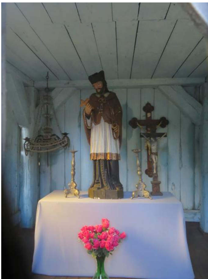
7. Boronów – kaplica św. Jana Nepomucena - wewnątrz