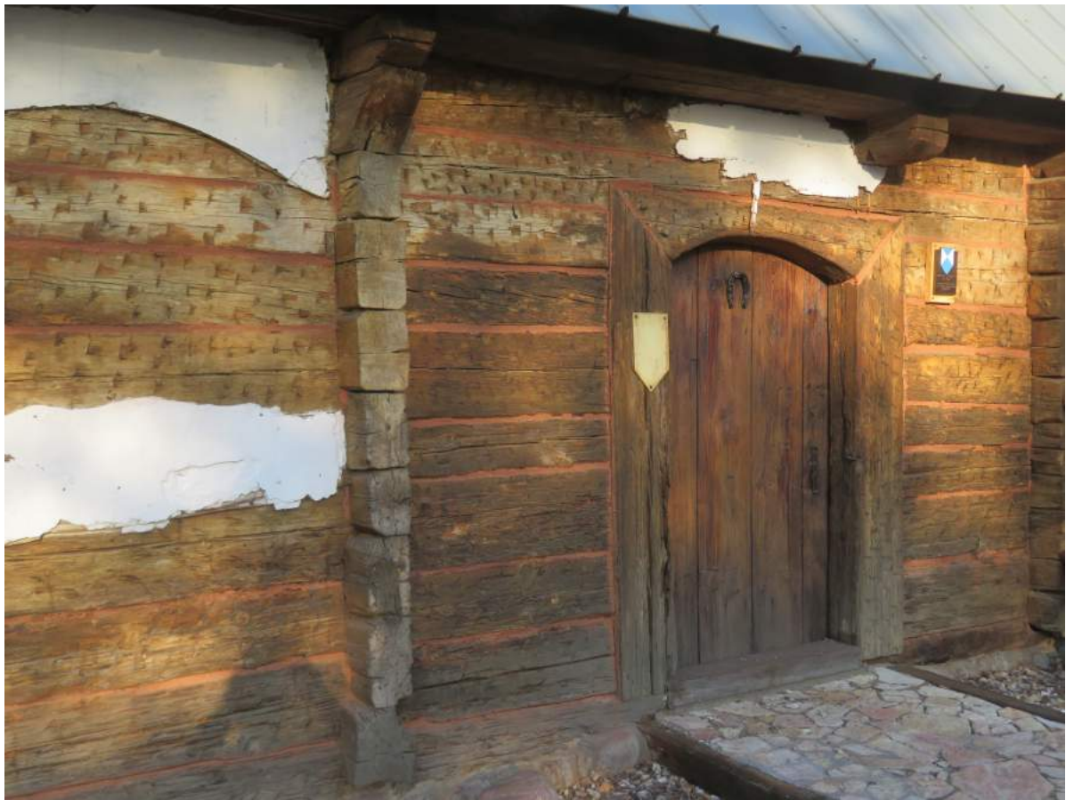
89. Zborowskie – fabryka fajek. Wejście, widoczne nacięcia belek pod tynkowanie 90. Zborowskie – fabryka fajek. Fragment ekspozycji