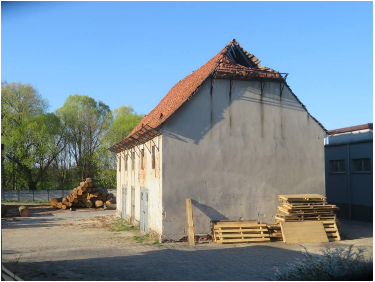
55. Kochanowice – spichlerz w zabudowaniach podworskich 56. Kochanowice – ul. Wiejska (budynki poza ewidencją)