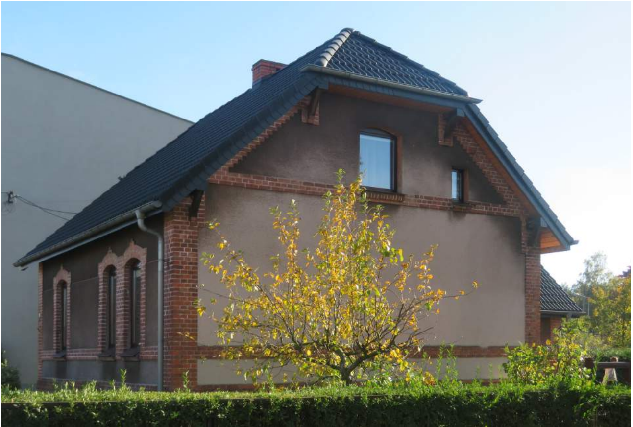
41. Herby – dom ul. Lesna 4