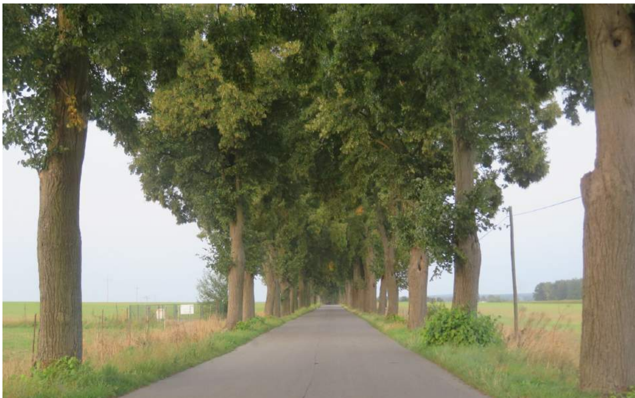
37. Harbułtowice – droga w kierunku Droniowic 38. Herby – budynki ul. Lubliniecka 62-64