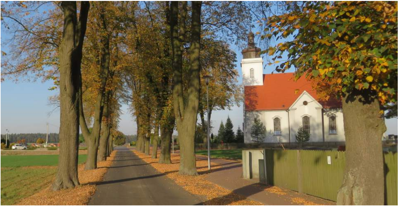
85. Zborowskie – widok na kościół i aleję