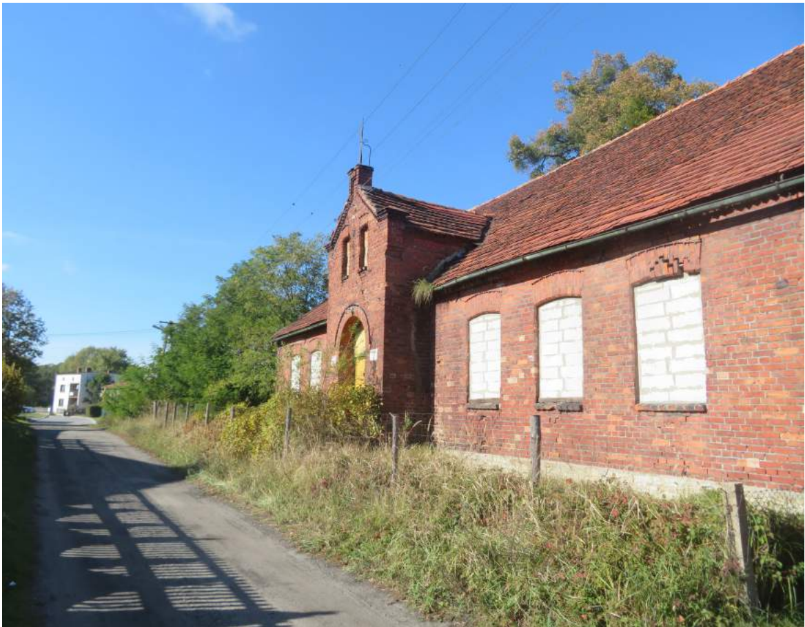
13. Boronów – budynek tzw. „Starej szkoły” 14. Boronów – bramka przy kościele