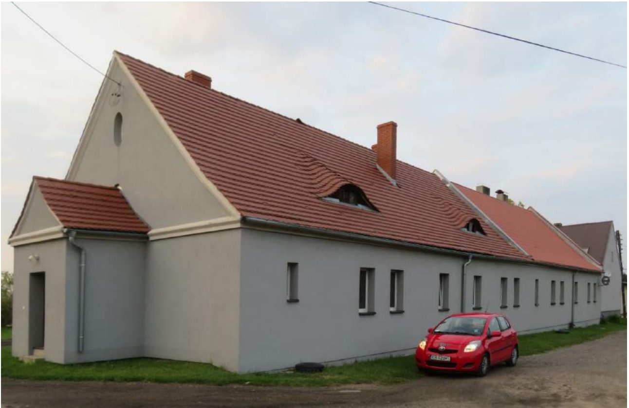
33. Hadra – czworak w zespole pofolwarcznym 34. Hadra – rządówka w zespole pofolwarcznym