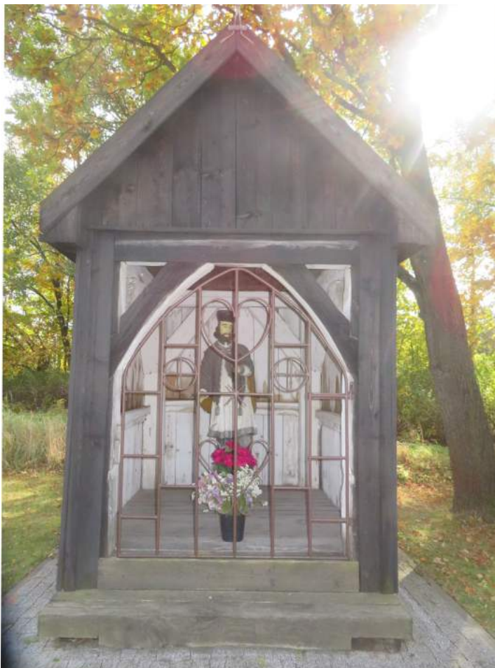
28. Dębowa Góra – kapliczki św. Jana Nepomucena i Najśw. Serca Pana Jezusa