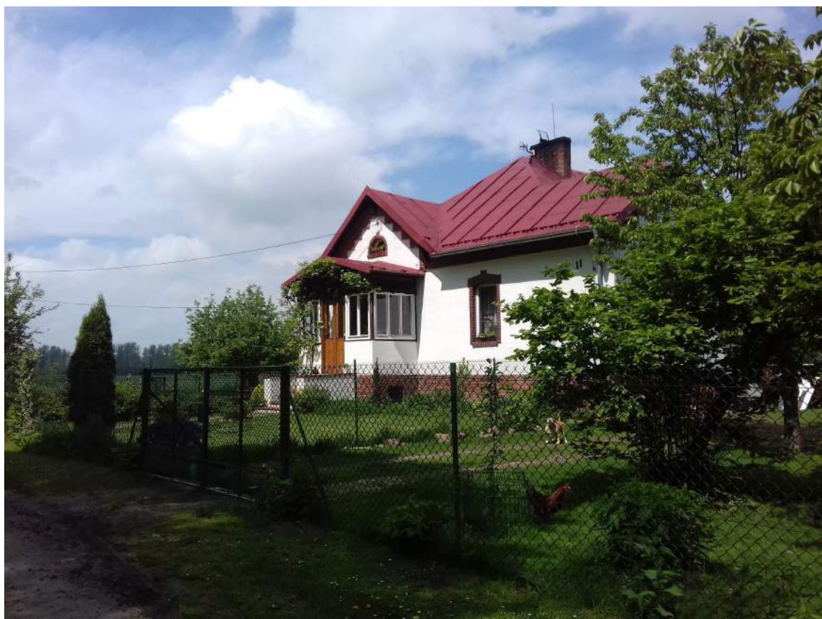
83. Szklarnia – leśniczówka, ob. dom mieszkalny 84. Turza – budynek nr 1