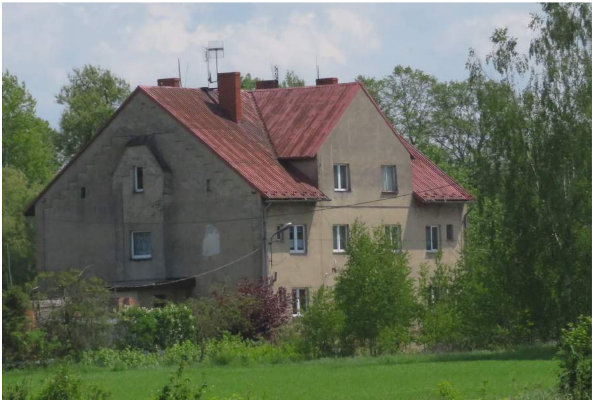
18. Braszczok – pofolwarczny budynek mieszkalny