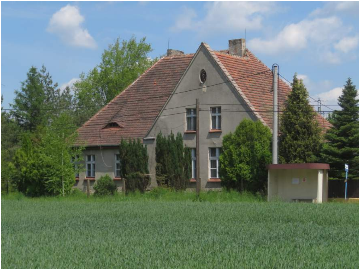
17. Braszczok – szkoła