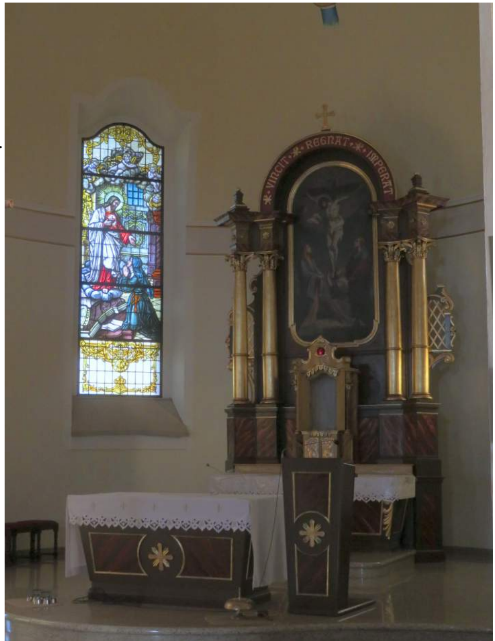
86. Zborowskie – kościół. Ołtarz główny i współczesny witraż