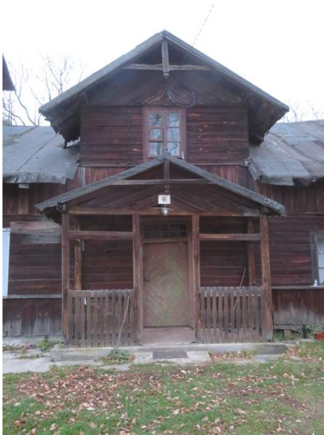
63. Kamińsko – budynek mieszkalny przy młynie