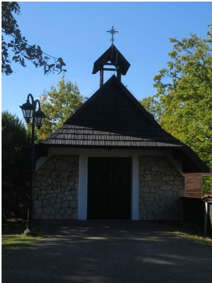
10. Boronów – nowa kostnica przy kościele