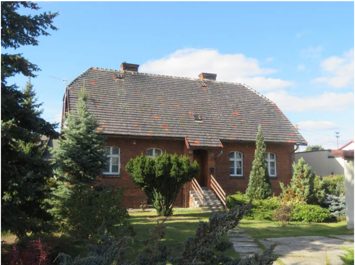
12. Boronów – budynek dawnej komory celnej, ob. mieszkalny