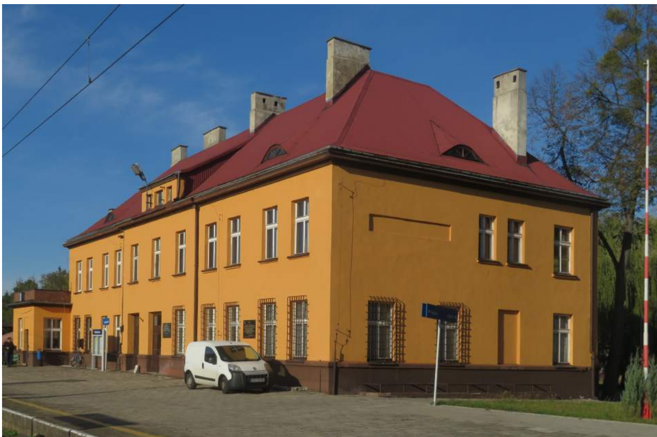
49. Herby Nowe – budynek stacji na linii kolejowej Śląsk – Gdynia 50. Herby Nowe - „pomnik” kolejowej linii Śląsk – Gdynia