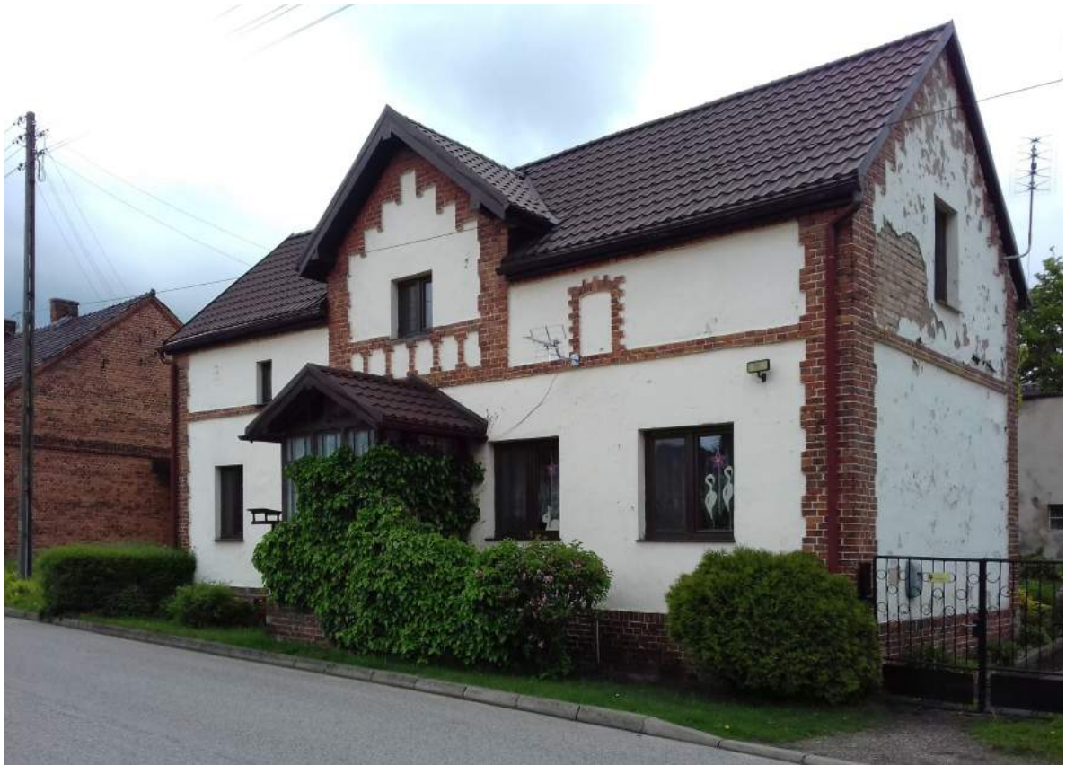
25. Cieszowa – dom mieszkalny, ul. Kasztanowa 39 26. Chwostek – dom, ul. Morcinka 75