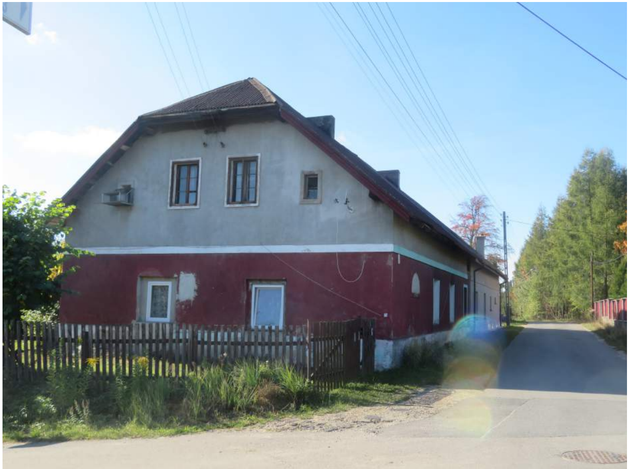
31. Grojec – budynek pofolwarczny 32. Hadra – szkoła