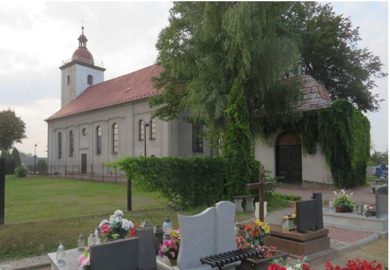
58. Kochanowice – widok na kościół od strony cmentarza