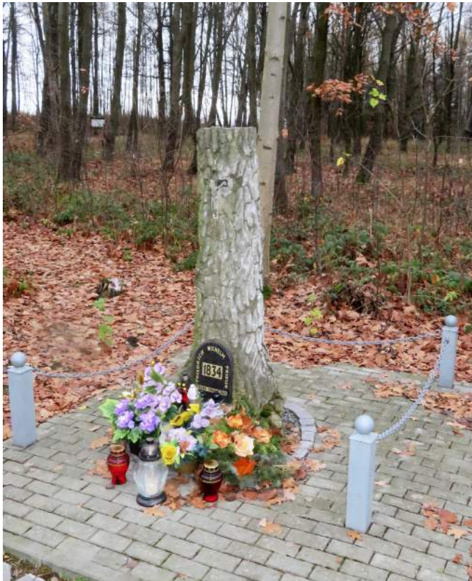
15. Boronów – Kolumna upamiętniająca na miejscu śmierci zarządcy Prieura