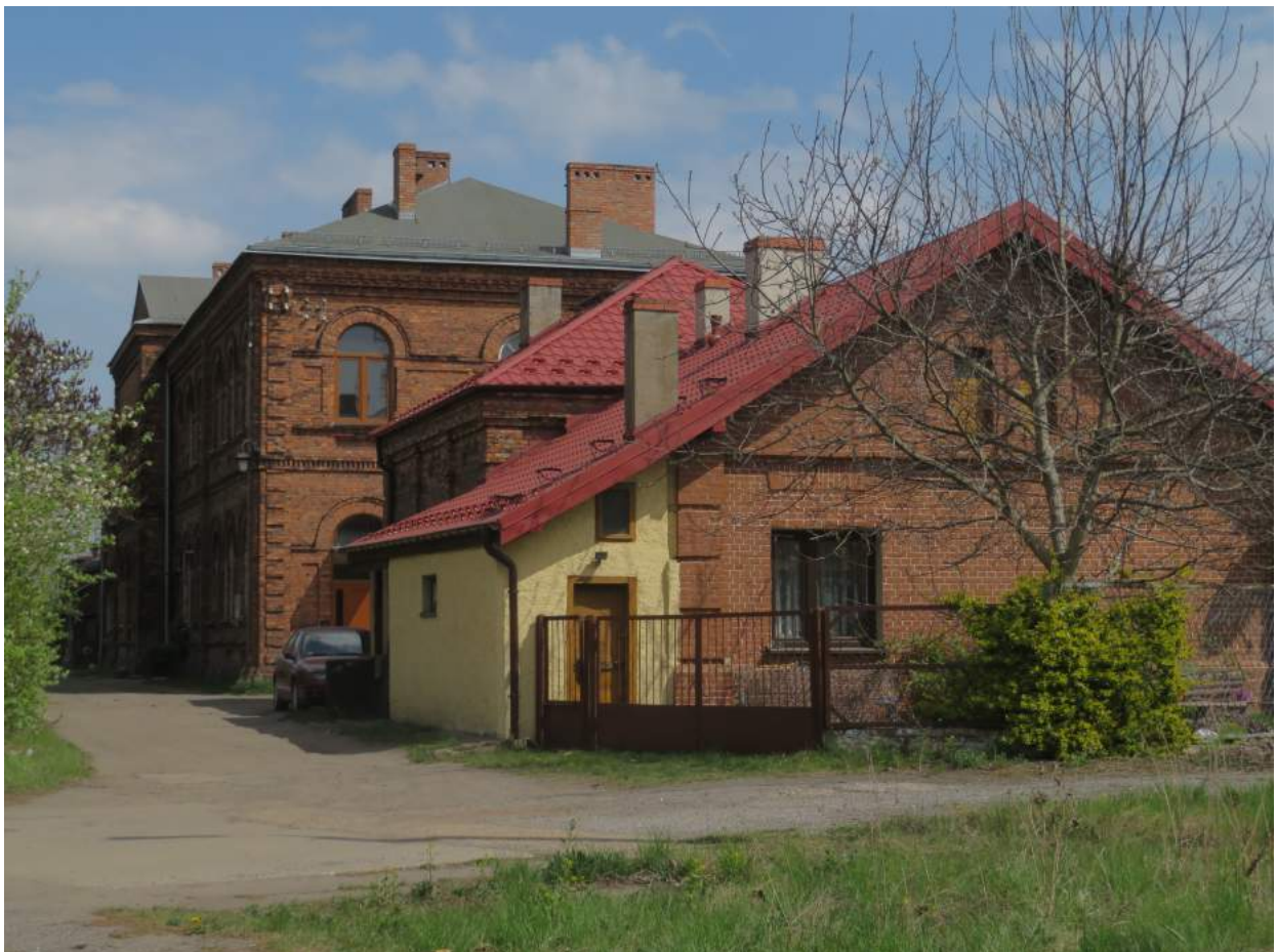
42. Herby – budynki d. dworca kolei herbskiej (rosyjskiej)