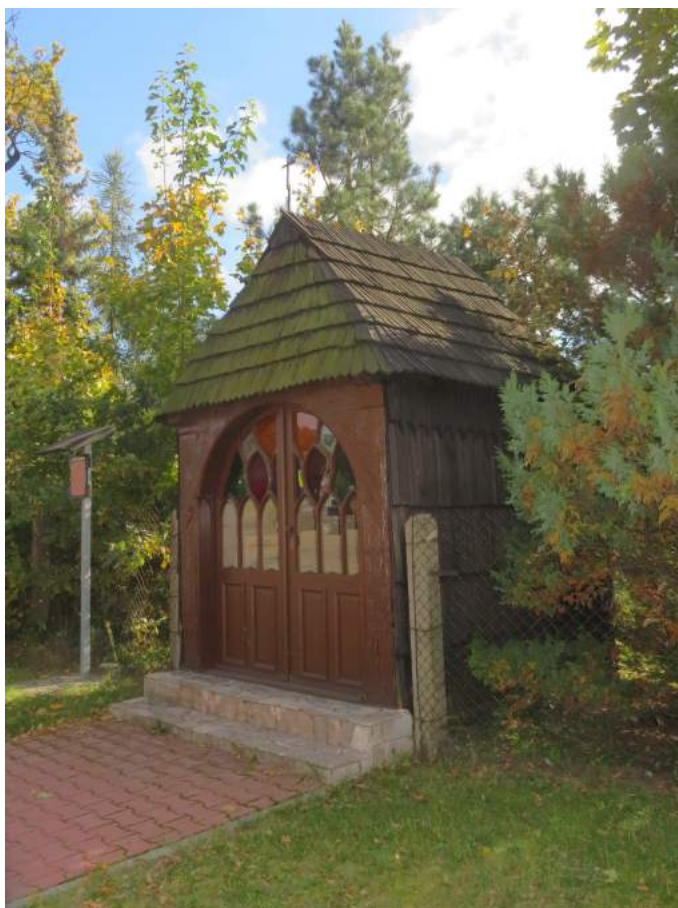
8. Boronów – kaplica św. Barbary