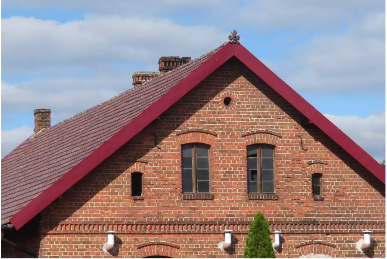
29. Dębowa Góra – Szczyt budynku mieszkalnego nr 19 30. Grojec – szkoła, ob. Budynek mieszkalny