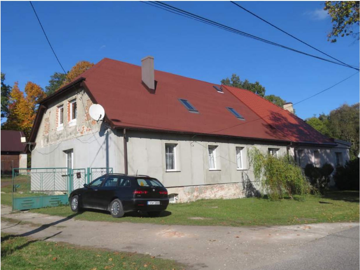
93. Zumpy – budynek nadleśnictwa 94. Zumpy – Budynek ul. Kolonijna nr 29