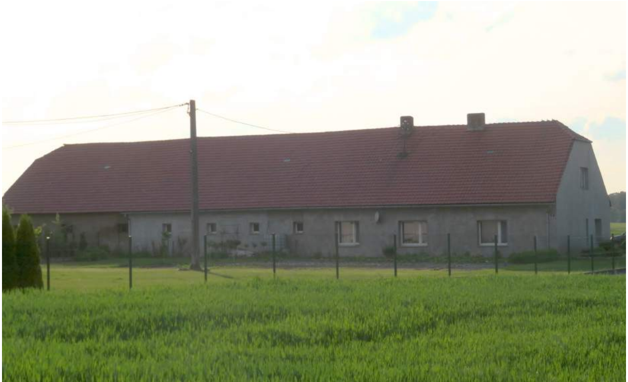
27. Chwostek – budynek pofolwarczny