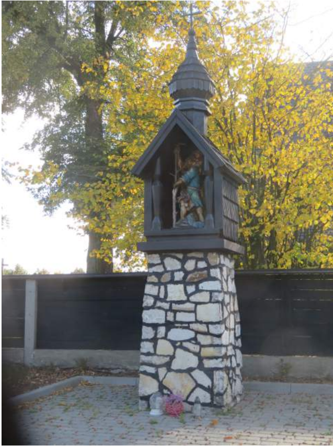
11. Boronów – nowa kapliczka św. Krzysztofa przy kościele