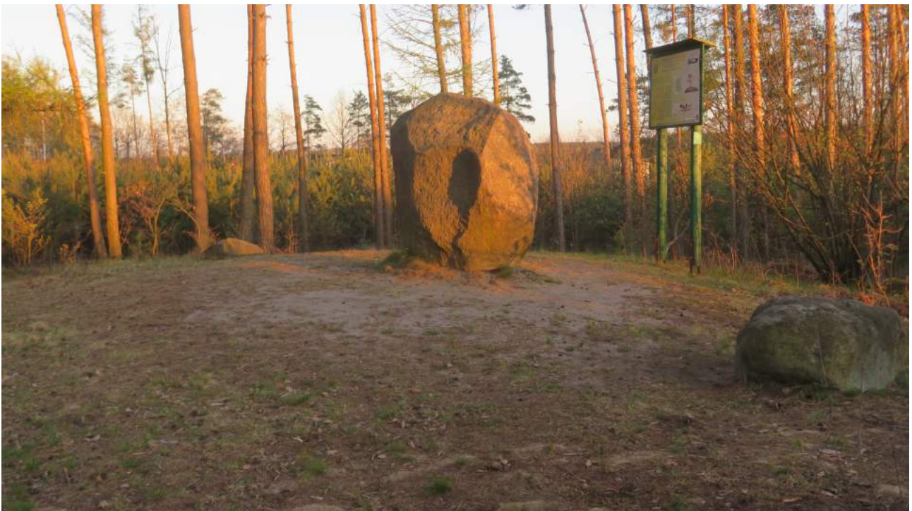
78. Olszyna - „Diabelski Kamień” na miejscu d. kaplicy grobowej