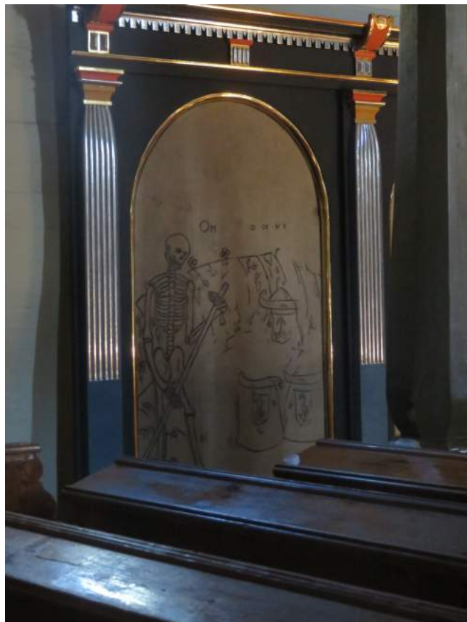
4. Boronów – kościół, wnętrze. Detal.