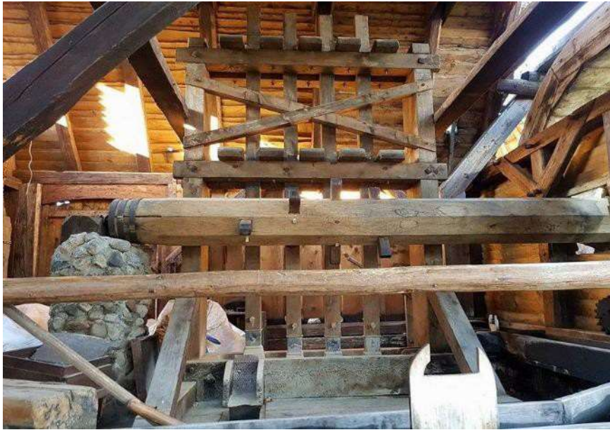
Fotografia przedstawiająca przykładowe odtworzenie rozdrabniaczy i ich pracę.

dostosowane do wielkości tłuczków, do których będzie wsypywana ruda poddawana kruszeniu. Dostęp do w/w koryt powinien umożliwiać zasyp i usunięcie rudy. Do urządzenia dołączyć odpowiednie szufle łopaty itp. umożliwiające usunięcie rudy. Narzędzia do usuwania rudy winny być dostosowane do szerokości koryt. Dodatkowo dostarczyć pojemniki drewniane służące do przechowywania i transportu rudy. Całość winna być wykonana z drewna w tradycyjnej technologii z zachowaniem źródeł historycznych. Przykładowy rozdrabniacz przedstawiony na fotografii poniżej.