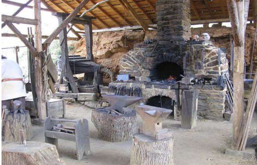
Fotografia przedstawiająca kuźnię

Kuźnia wraz z piecem i wyposażeniem - piec kuźniczy z paleniskiem wykonany w tradycyjnej technologii kamienny. Miech winien być podłączony do paleniska ujęcie spalin odprowadzone kominem. Gabaryt podstawy pieca nie mniejszy niż 2x2 m.