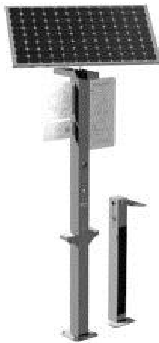
Słup Street Stick [ http://smartbynature.pl .]

Street Stick jako słup informacyjno-reklamowy,