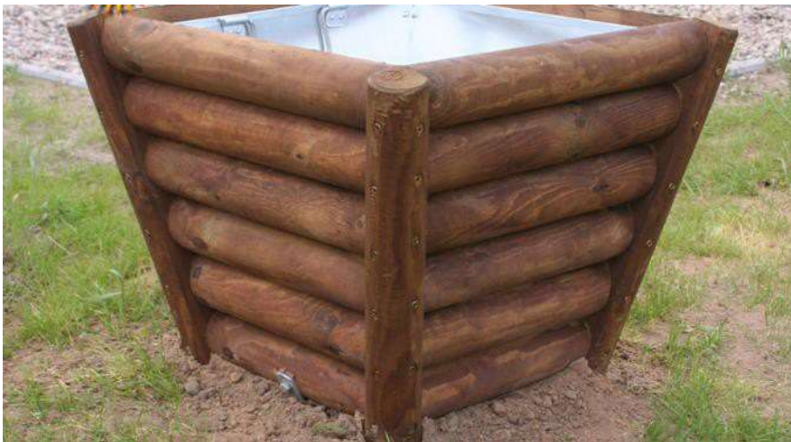
Przykładowa realizacja drewnianego kosza [ www.placzabawzdrewna.pl ].

Kosz drewniany z wypełnieniem środka w postaci folii aluminiowej/PCV. Wymiary [dł. x szer. x wys.] [m]: 0,45 x 0,30 x 1,00.