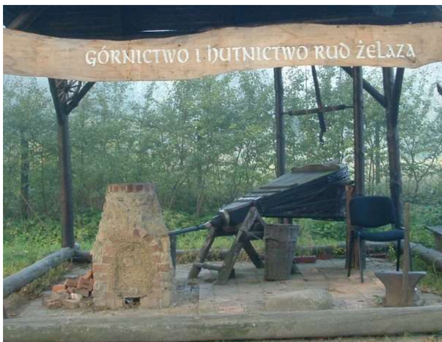
Zdj. (źródło - fotografia własna)