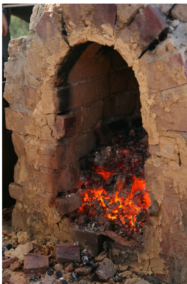
Zdjęcia przykładowego pieca dymarskiego