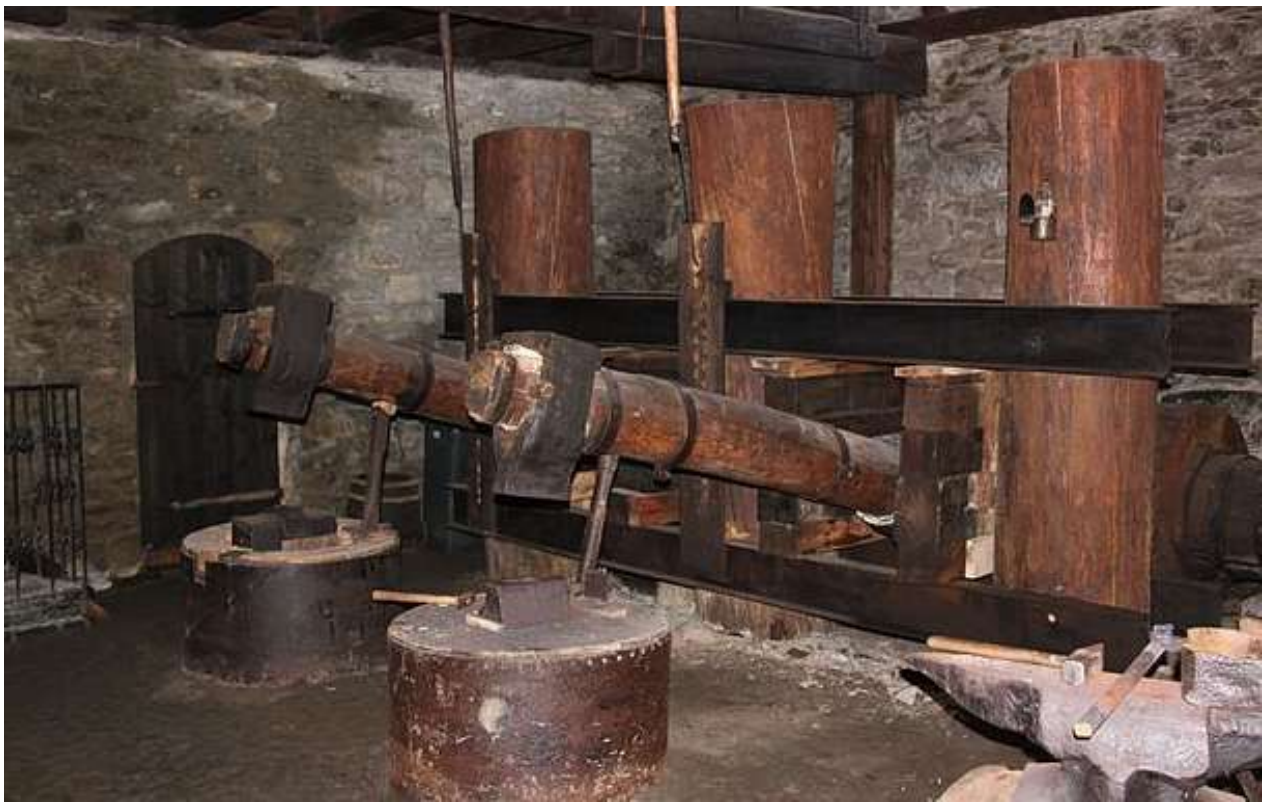
Fotografia przedstawiająca młoty podrzutowe

Młot kuźniczy podrzutowy napędzany kieratem - młot służący do rozbicia spieków po wyjęciu z dymarki. Młot winien być wykonany z drewna odpowiednio dobranego i składać się z elementu obuchowego (młota) o wadze nie mniejszej niż 100 kg umieszczonego na ramieniu drewnianym. Napęd młota stanowić ma kierat poziomy czteroramienny (dopuszcza się większą ilość ramion). Kierat z młotem ma być połączony za pomocą odpowiednio dobranych przekładni (kół drewnianych odpowiedniej wielkości i przełożeniu) umożliwiającej pracę młota. Siła konieczna do pracy młota napędzanego za pomocą kieratu winna być tak dobrana by napęd (ruch kieratu) możliwy był przy użyciu pracy wykonywanej przez dwójkę dzieci podczas pokazu. Ponadto urządzenie wyposażać w kowadło, w które będzie uderzał młot podczas pracy. Wielkość kowadła winna być dostosowana do wielkości i mocy młota. Kowadło winno być posadowione stabilnie na pniu kowalskim. Przykładowy młot kowalski przedstawiony na fotografii poniżej.