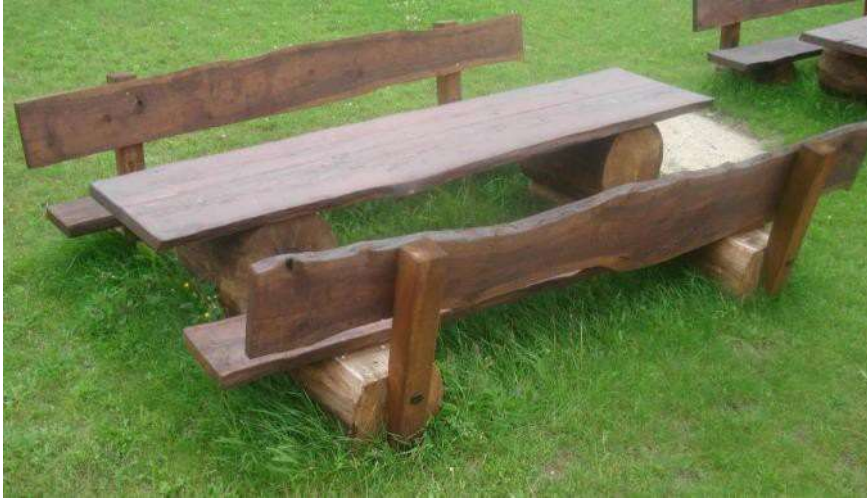
Przykładowa realizacja ławek i stolika.

Kosz drewniany z wypełnieniem środka w postaci folii aluminiowej/PCV. Wymiary [dł. x szer. x wys.] [m]: 0,45 x 0,30 x 1,00.