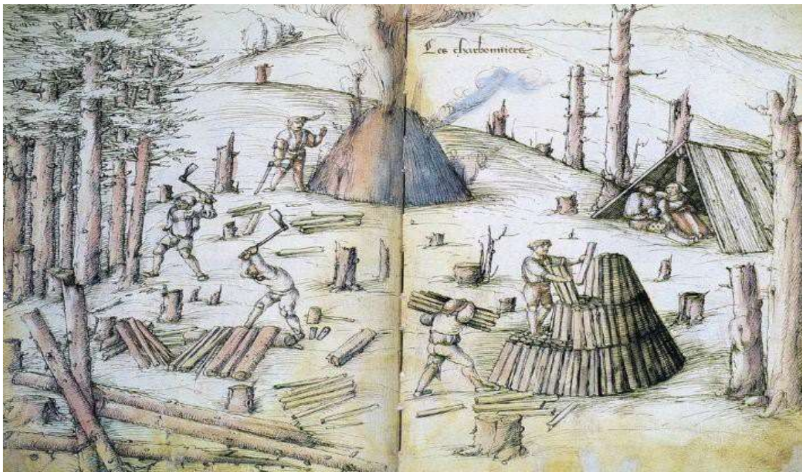
Rycina przedstawiająca mielerze.

Rozdrabniacz napędzany kieratem (duży) - winien być wykonany z drewna odpowiednio przygotowanego i składać się z minimum czterech elementów ubijających „tłuczków” o wysokości nie mniejszej niż 2 m o przekroju kwadratu nie mniejszym nie 30X30 cm., zakończonych stalowym elementem urabiającym. Tłuczki wprawiane w ruch są za pomocą wału napędowego o okrągłym przekroju dostosowanym do ciężaru tłuczków i umożliwiającym ich ruch w wyniku ruchu obrotowego za pomocą łopatek. Napęd rozdrabniacza stanowić ma kierat poziomy czteroramienny (dopuszcza się większą ilość ramion). Kierat z rozdrabniaczem ma być połączony za pomocą odpowiednio dobranych przekładni (kół drewnianych o odpowiedniej wielkości i przełożeniach) umożliwiających pracę rozdrabniacza. Siła konieczna do pracy rozdrabniacza napędzanego za pomocą kieratu winna być tak dobrana by napęd (ruch kieratu) możliwy był przy użyciu pracy wykonywanej przez dwójkę dzieci podczas pokazu. Bezpośrednio pod tłuczkami winny znajdować się odpowiednio wyprofilowane koryta